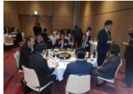
積極的な会員交流の様子