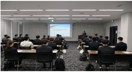
熱心に講義を受講するみなさん

よこてシャイニーパ レス3階ホールを会場 に、「新入社員のための 社会人に必要なビジネ スマナーセミナー」が開 催され、受講者は基本的 な心構えから印象管理、 コミュニケーションま で幅広く学びました。