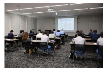
マネジメント力向上を目指して学ぶ様子